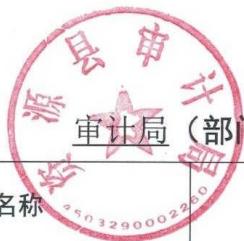
审计局（部门） 2022 年度行政检查实施情况统计表