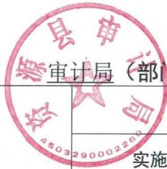
审计局（部门）2022 年度行政征收实施情况统计表