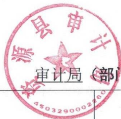
审计局(部门) 2022 年度行政征用实施情况统计表