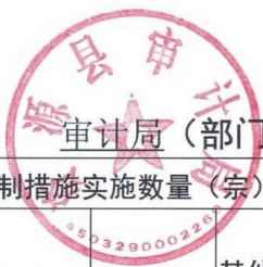
审计局（部门） 2022 年度行政强制实施情况统计表