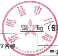
审计局(部门) 2022 年度行政许可实施情况统计表