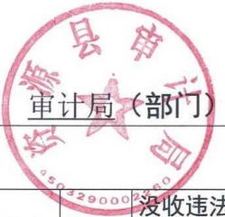
审计局(部门) 2022 年度行政处罚实施情况统计表